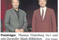
Preisträger. Thomas Vinterberg (re) und sein Darsteller Mads Mikkelsen.