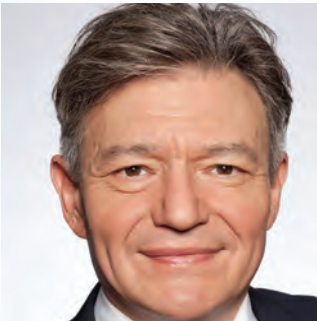
Horst Arnold, MdL

SPD-Landtagsabgeordneter für den Stimmkreis Nürnberg-West Betreuungsabgeordneter für den Landkreis Weißenburg-Gunzenhausen Sprecher der mittelfränkischen SPD-Landtagsabgeordneten Vorsitzender des Arbeitskreises der BayernSPD-Landtagsfraktion für Fragen des Öffentlichen Dienstes stefan.schuster@bayernspd-landtag.de | stefan-schuster-mdl.de